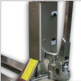
Komple paslanmaz çelik yapı