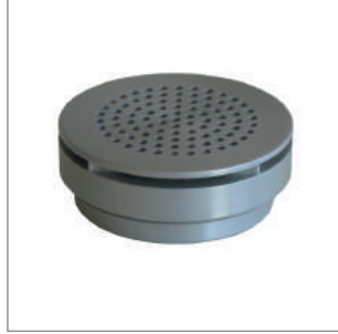
Su Buharı Geçirgenlik Kiti