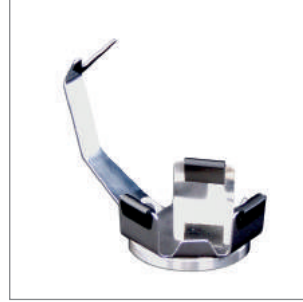
Analitik Teraziler İçin Tüp Tutucu