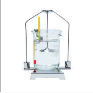
Yoğunluk Tayin Kiti