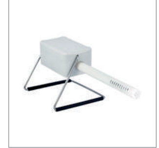
Ortam Koşulları Takip Modülü (Nem-Basınc-Sıcaklık)