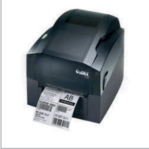
GODEX G300 - Label Yazıcı