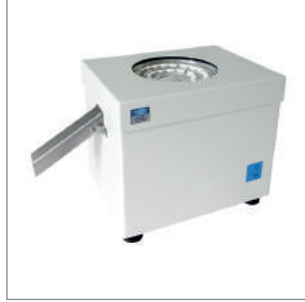
Otomatik Tablet Besleyici