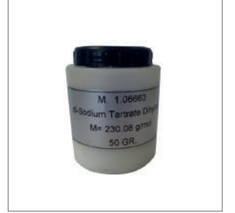
Nem Tayin Referans Maddesi