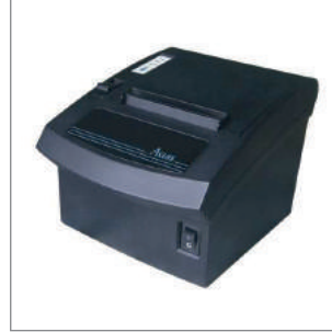
ACCLASS PP7 - Termal Yazıcı