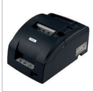
TMU220D - Dot Matrix Yazıcı (Nokta Vuruşlu)