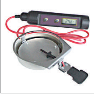
Nem Tayin Sıcaklık Kontrol Seti