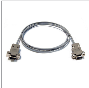
Data Kablosu (Printer, Pc)