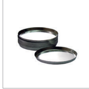
Nem Tayin Alüminyum Tartım Kabı